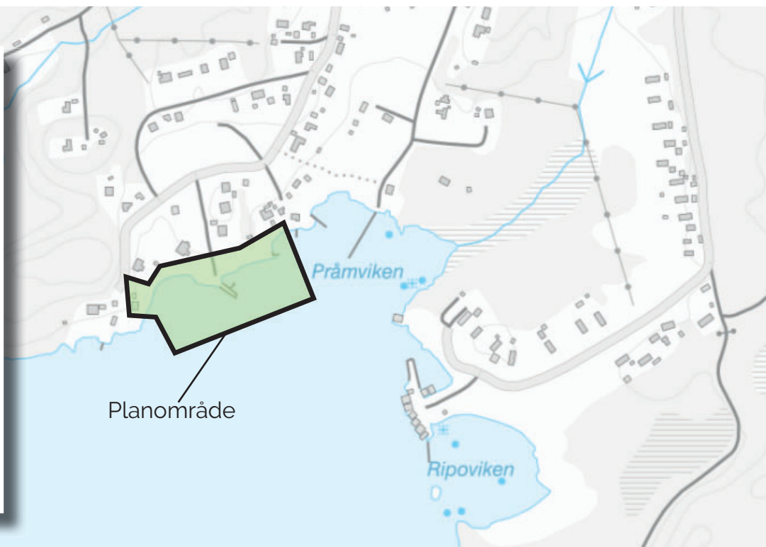
Planområdets lokalisering och avgränsning markerad.